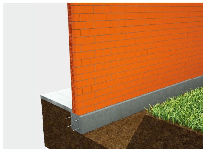
② Fondazione in c.a. di sezione di larghezza pari alla muratura.