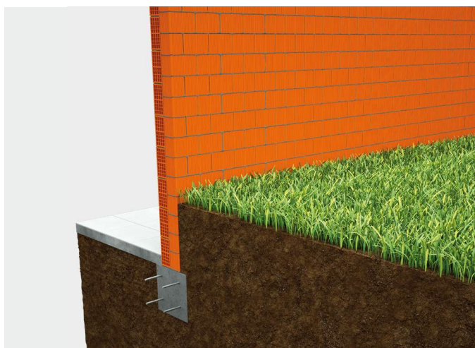
① Scavo a scoprire il bordo della fondazione