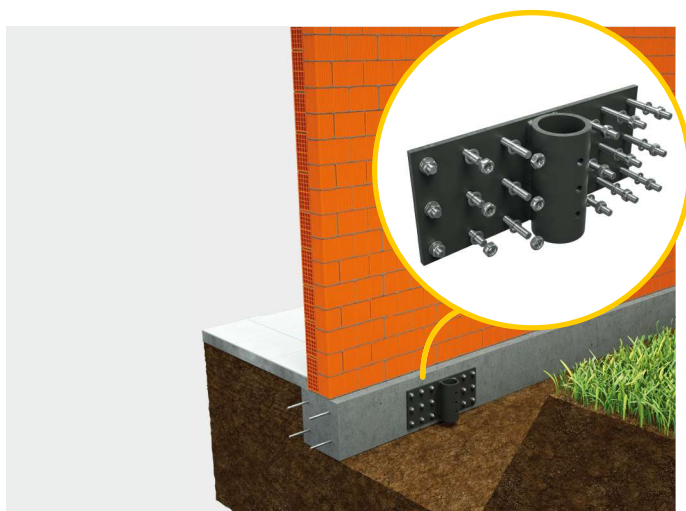
③ Tassellatura della piastra.