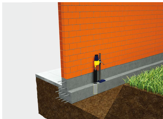
② Carotaggio dell'ala di fondazione.