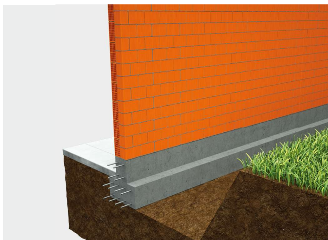
① Fondazione in c.a. a sezione a T rovescia.