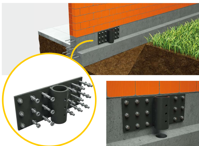
③ Tassellatura della piastra all'anima della T rovescia.