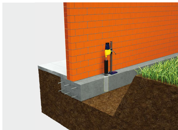
② Carotaggio della fondazione.