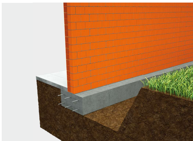
① Fondazione in c.a. di sezione di larghezza ben superiore alla muratura.