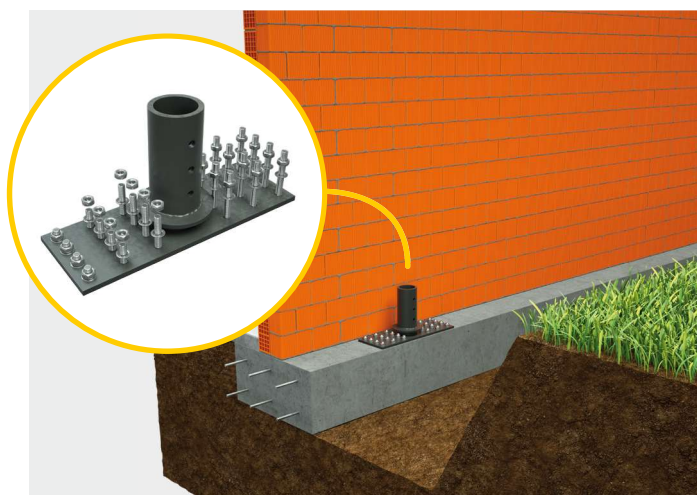
③ Tassellatura della piastra all'estradosso della fondazione.